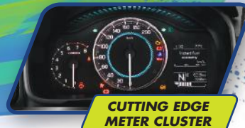
CUTTING EDGE METER CLUSTER

Serunya eksplorasi dengan mode touchscreen