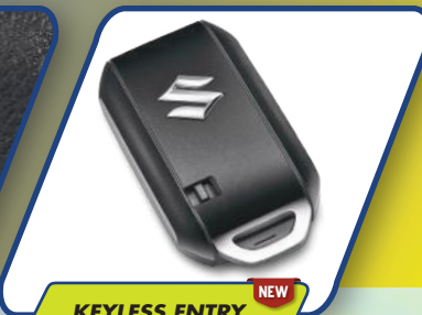
KEYLESS ENTRY NEW

Praktis dan dinamis dengan Push Start Stop Button