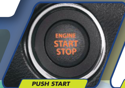
PUSH START STOP BUTTON

Mesin yang efisien dapat diandalkan untuk setiap perjalanan