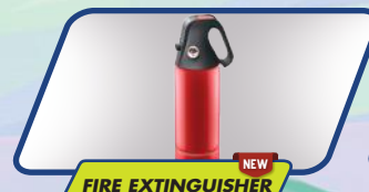
FIRE EXTINGUISHER NEW

Fitur keselamatan semakin lengkap dengan tersedianya alat pemadam api ringan