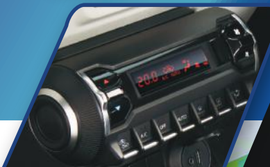
AUTO CLIMATE A/C WITH HEATER

NEW IGNIS sebagai generasi baru URBAN SUV, hadirkan fitur-fitur berkelas. Mendukung mobilitas perkotaan yang dinamis baik dari sisi kenyamanan, keamanan, dan juga power.