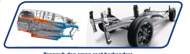
Tangguh dan aman saat berkendara

Mencegah roda mengunci saat pengereman mendadak