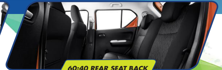
60:40 REAR SEAT BACK