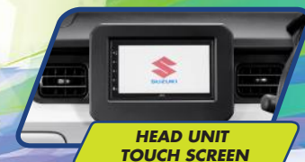
HEAD UNIT TOUCH SCREEN

Serunya eksplorasi dengan mode touchscreen