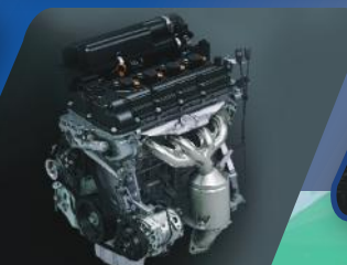
EFFICIENT K12M ENGINE

Mesin yang efisien dapat diandalkan untuk setiap perjalanan