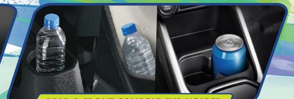
REAR & FRONT CONSOLE CUP HOLDER