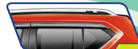
Detail yang stylish dan sporty

Tampilan NEW IGNIS yang unik, sporty, dan stylish semakin terlihat dengan tambahan bermacam aksesoris yang menambah nilai gaya hidup urban.