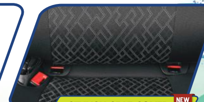
STYLISH SEAT COVER NEW

Lapang dan praktis untuk setiap eksplorasi