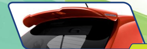
Berikan kesan sporty pada bagian atas