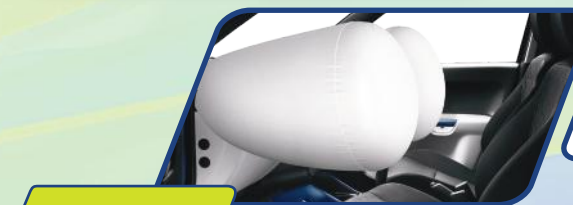
DUAL SRS AIRBAG

Melalui berbagai teknologi kaman terkini, NEW IGNIS berikan ketenangan serta kenyamanan saat berkendara.