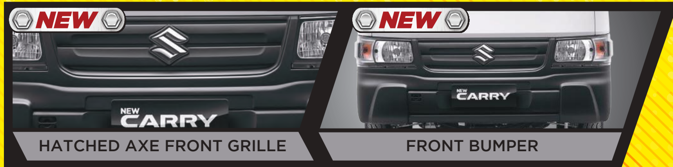
HATCHED AXE FRONT GRILLE

Tangguh dan kuat untuk bawa untung bisnis Anda.