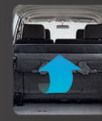
Lipatan bangku ke 3