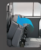
Lipatan bangku ke 2