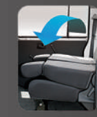
Lipatan bangku ke 1