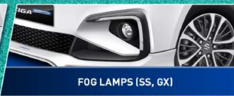
FOG LAMPS (SS, GX)