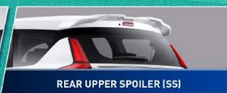
REAR UPPER SPOILER (SS)