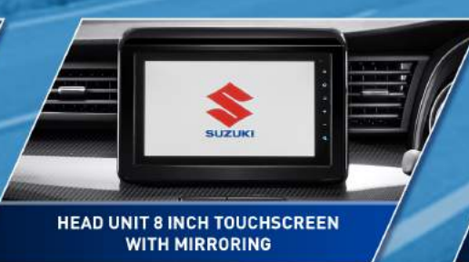
HEAD UNIT 8 INCH TOUCHSCREEN WITH MIRRORING