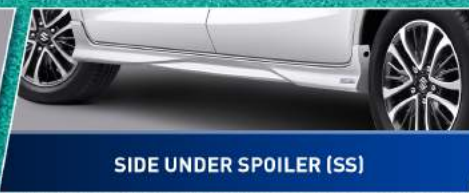
SIDE UNDER SPOILER (SS)