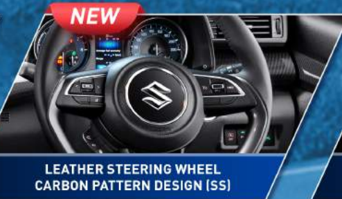
LEATHER STEERING WHEEL CARBON PATTERN DESIGN (SS)