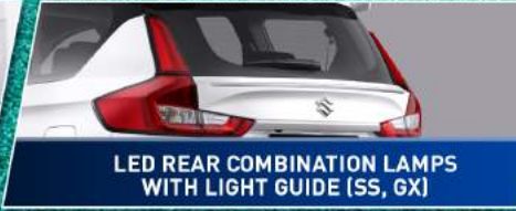
LED REAR COMBINATION LAMPS WITH LIGHT GUIDE (SS, GX)