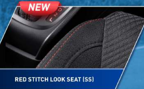
RED STITCH LOOK SEAT (SS)