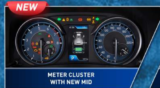
METER CLUSTER WITH NEW MID