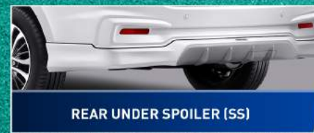
REAR UNDER SPOILER (SS)