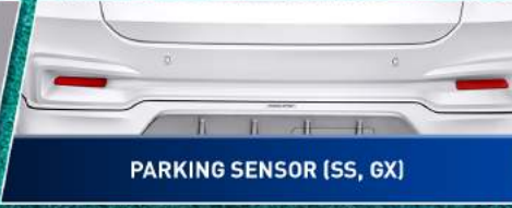
PARKING SENSOR (SS, GX)