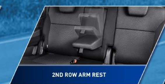
2ND ROW ARM REST