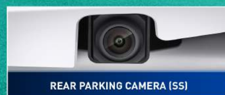
REAR PARKING CAMERA (SS)

All New Ertiga Hybrid hadir dengan tampilan baru yang modern sesuai perkembangan zaman. Sebuah mobil keluarga pintar dengan tampilan premium dan stylish, siap menjadi mobil Kebanggaan Keluarga.