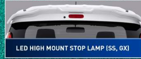
LED HIGH MOUNT STOP LAMP (SS, GX)