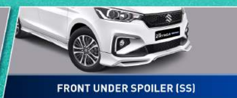
FRONT UNDER SPOILER (SS)