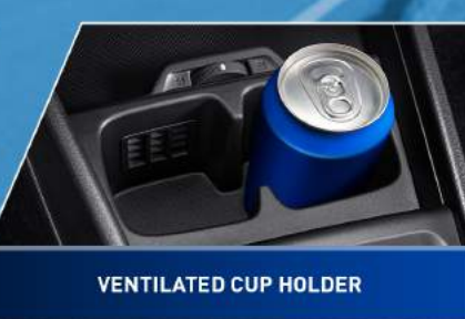
VENTILATED CUP HOLDER